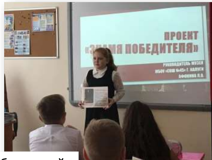
МБОУ № 45 «Знамя победителей»