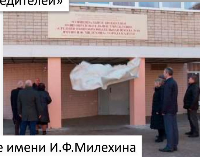
МБОУ № 16 присвоение имени И.Ф.Милехина