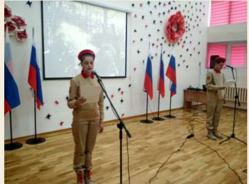
Урок мужества "Поклонимся Великим тем годам"