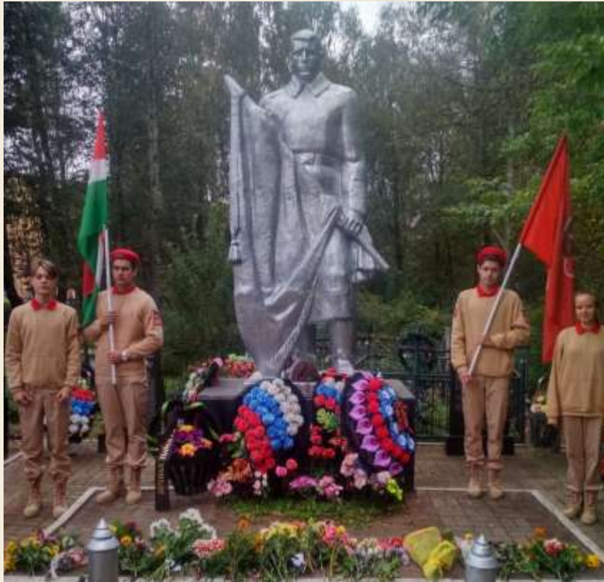
Торжественный митинг у могилы Неизвестного солдата