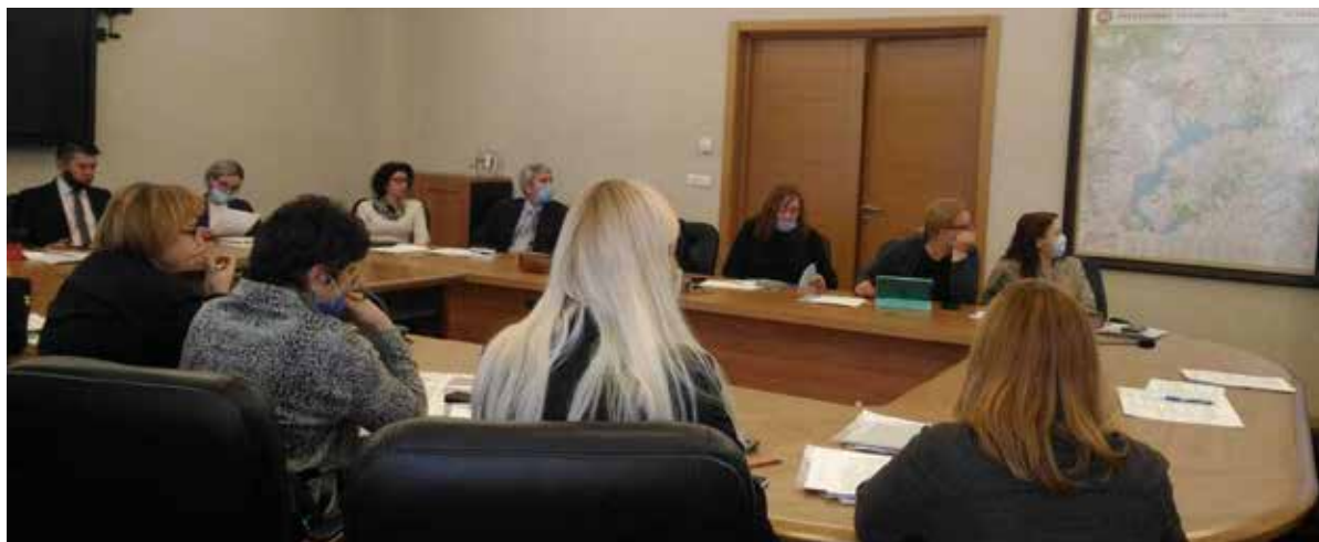
Рис. 3. Проведение межведомственной супервизии в Республике Татарстан.

— межведомственные по ситуациям комплексного характера — 27 (суицид + химическая зависимость, проблема посещения образовательной организации + здоровье, риски нехимической зависимости, суицидальные риски