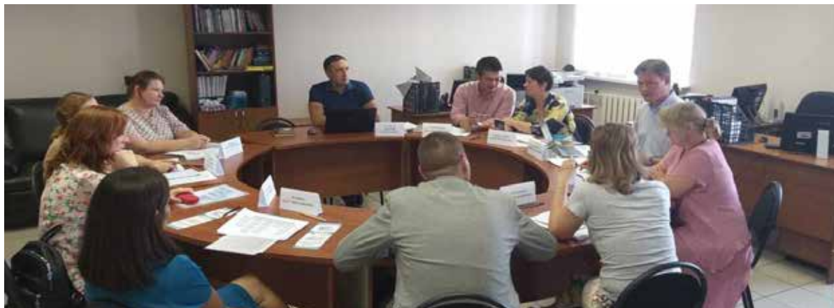
Рис. 1. Проведение межведомственной супервизии в Республике Татарстан.