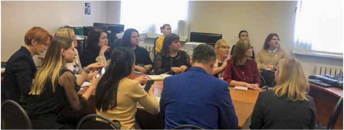
Рис. 2. Проведение межведомственной супервизии в Республике Татарстан.

— высокий риск тяжелых последствий в связи с домашним насилием;