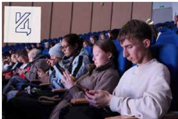
Рис. 2. Первокурсники принимают участие в адаптационном профилактическом квизе.

Все работники Координационного центра в своей деятельности учитывают тот факт, что деструктивная коммуникация между новыми студентами закладывает почву для конфликтного поведения в межличностных отношениях. Первокурсники первые месяцы обучения испытывают стрессовое состояние,