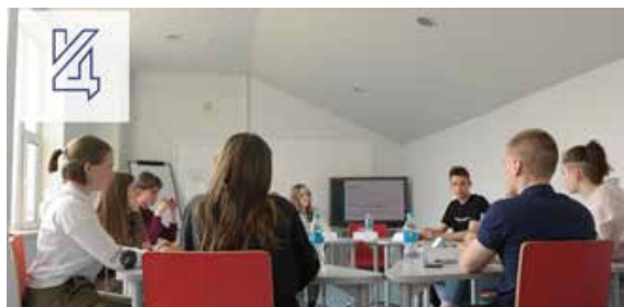
Рис. 5. Проведение Координационным центром ДВФУ Школы цифровой грамотности для студентов-первокурсников.

На сегодняшний день проект «Наставник» подготовил около 250 наставников. Каждый наставник проходит специализированную подготовку, в которую входит изучение нормативно-правовой базы деятельности