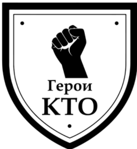
Рис. 1. Логотип проекта «Герои КТО»

Проект «Герои КТО» — это цикл видеоинтервью с современными героями,